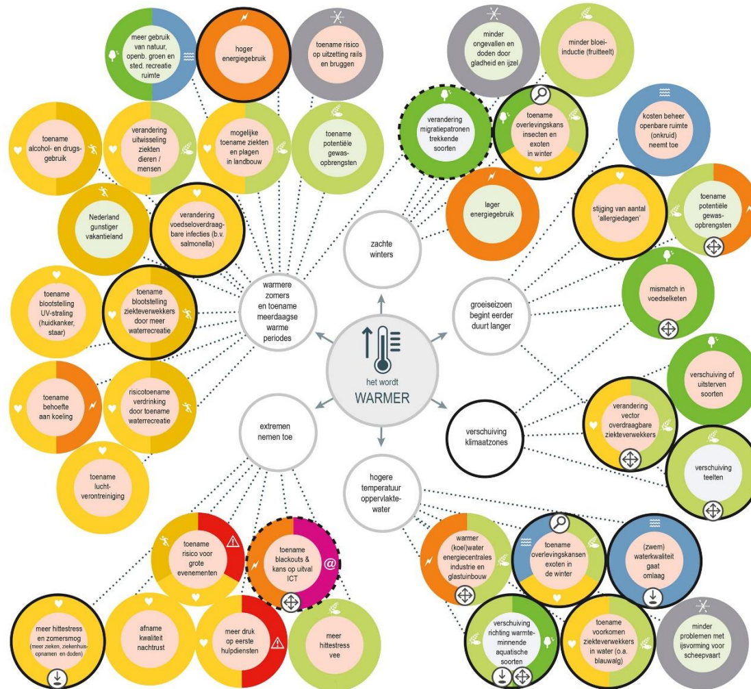
Bollenschema_warmer_V13, 28 november 2016